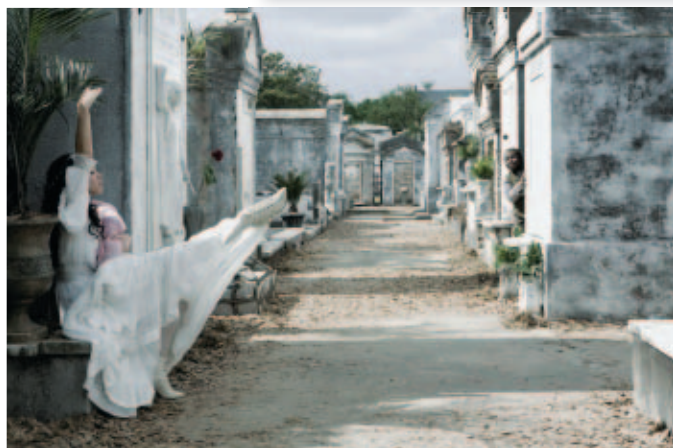
Кадр из картины «Луи» и снявший его Вильмос Жигмонд