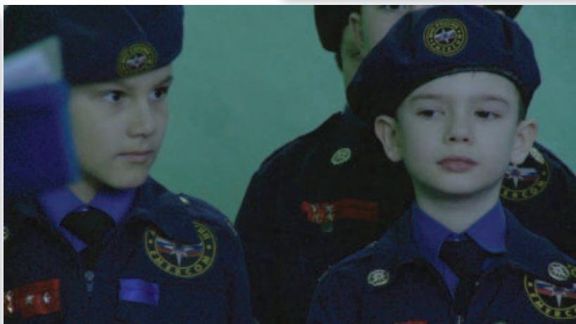
Кинематографист Петр Стасик (вверху) и кадр из фильма «Последний день лета»