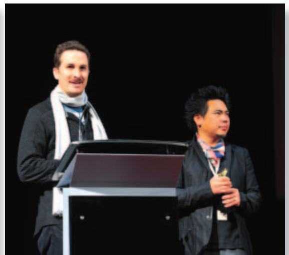
Даррен Аронофски (слева) и Мэтью Либатик