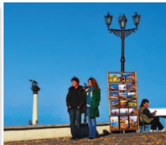
Кадр из фильма «Кто я?»

В конкурсе операторских дебютов фигурировал и российский фильм «Кто я?» режиссера Клима Шипенко и оператора Андрея Иванова. Действие начинается на вокзале Севастополя, где милиционеры задерживают молодого человека без документов, который не помнит ни своего имени, ни каких-либо фактов из своего прошлого. Зато помнит множество исторических дат, песен своей любимой группы «Серьга» и т.д. Расследование ведут двое – следователь и психиатр. Стоит посмотреть, чем все кончится.