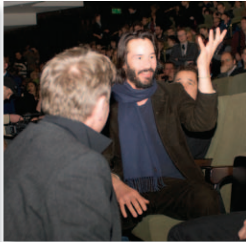
Кяну Ривз в Opera Nova