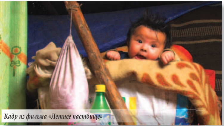
Кадр из фильма «Летнее пастбище»

шесть человек, и каждый из них по-своему интересен, некоторые что-то скрывают о своем прошлом, к которому они не хотят больше возвращаться. А кого-то, привыкшего к такой жизни, пугает «гражданка». Старые и опытные пограничники учат новобранца премудростям севера. И хотя, по мнению создателей фильма, сама по себе служба на такой заставе, как и само ее существование, является абсурдом, картина получилась на удивление доброй – после того, как в зале зажегся свет, на лицах зрителей читалась симпатия к тем, кого они только что видели на экранах.