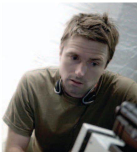
Режиссер Дэвид Миход