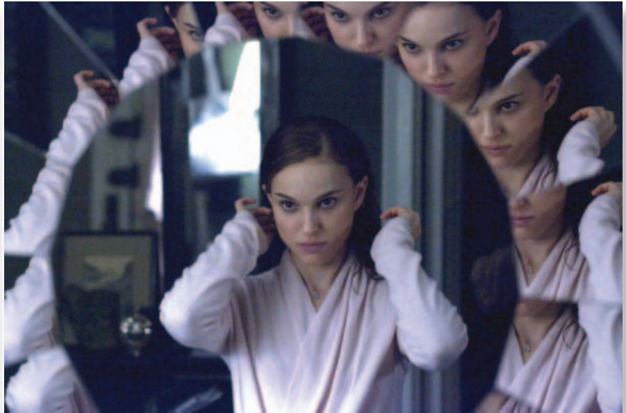
Кадр из фильма «Черный лебедь»

«Черный лебедь» изобилует планами, снятыми в документальном стиле. Во многих сценах оператор применял очень небольшое количество осветительных приборов, а в некоторых вообще обошелся естественным освещением.