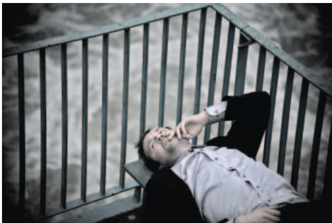
Кадр из картины «Ошибка»