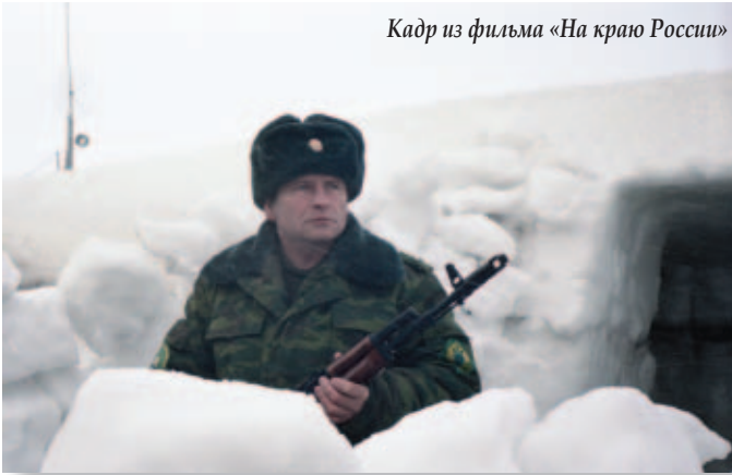
Кадр из фильма «На краю России»