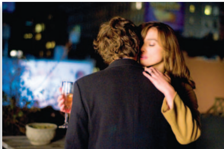
Кадр из картины «Последняя ночь»